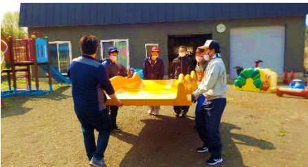
近隣保育園敷地内の環境整備