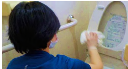
デイサービスの一般清掃