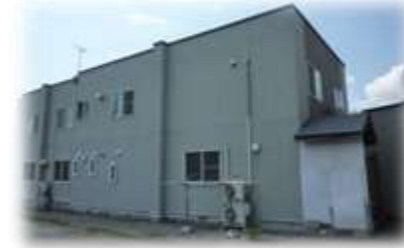
第1スワンハイム 青森県東津軽郡平内町小湊地区 定員: 7名