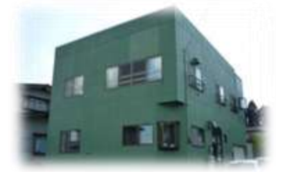
第3スワンハイム 青森県東津軽郡平内町小湊地区 定員: 6名