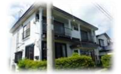
第2スワンハイム 青森県東津軽郡平内町小湊地区 定員: 6名