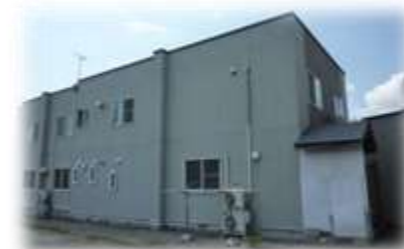
第1スワンハイム 青森県東津軽郡平内町小湊地区 定員：6名