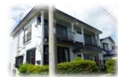
第2スワンハイム 青森県東津軽郡平内町小湊地区 定員：6名