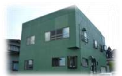
第3スワンハイム 青森県東津軽郡平内町小湊地区 定員：6名