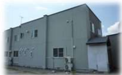
第1スワンハイム 青森県東津軽郡平内町小湊地区 定員：6名