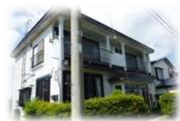
第2スワンハイム 青森県東津軽郡平内町小湊地区 定員：6名