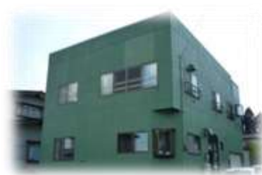
第3スワンハイム 青森県東津軽郡平内町小湊地区 定員：6名